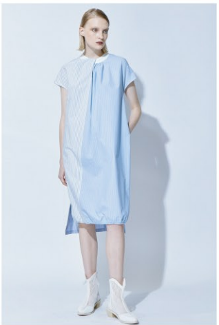
PHOTO : 2023 SS Collection